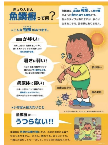
資料1:魚鱗癬のパンフレット

10月には、職業体験として動物園での飼育作業体験を実施した。その際、移動に路線バスや電車を利用し、財布から小銭を出す必要がないAkiCAを使ってスムーズに移動できた(写真2)。