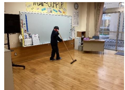
写真1:教室清掃の様子